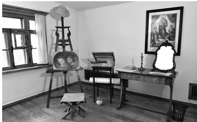
Художня майстерня Шевченка