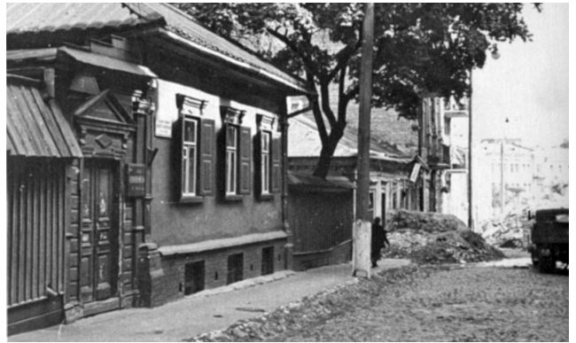
Фасад будинку Житницького, що виходить на нинішній провулок Шевченка

Наукове керівництво здійснював В. Міяковський, який став першим директором музею і який на той час мав глибокі знання як архівіст, учений, шевченкознавець. Він був дійсним членом Інституту Т. Шевченка (нині – Інститут літератури ім. Тараса Шевченка НАН України), завідував кабінетом біографії митця та рукописним відділом [1, арк. 7]. Ось його спогад: «Сам я з 1926-го року протягом трьох років керував кабінетом біографії Шевченка <...> В кабінеті біографії підготовлялася так звана канва життя і творчості поета-малюра, розпочате було складання словника Шевченкових знайомих і спеціальна увага була приділена топобіографічним студіям, себто збиранню матеріалів про місця перебування Шевченка, обмежуючись на перші роки самим Києвом. Одним із об'єктів дослідження був і будиночок у центрі Києва, на так званому в шев-