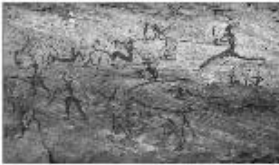
Наскальні малюнки й писемна